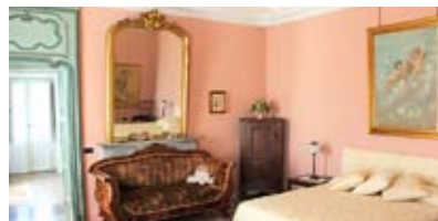
▲ CASTELLO DI CASTELLENGO ▲

Giarole (AL) Via Roma 5 ☎ 347 2505519 e 0142 68124; castellosannazzaro.it Prezzi: doppia da 80 € con colazione.