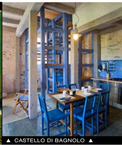
▲ CASTELLO DI BAGNOLO ▲