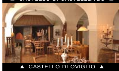
▲ CASTELLO DI OVIGLIO ▲