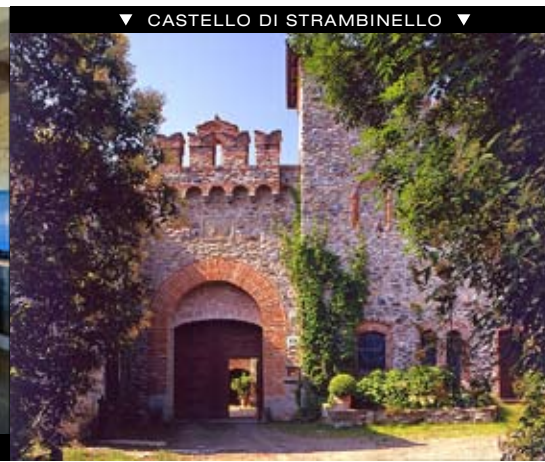
▼ CASTELLO DI STRAMBINELLO ▼