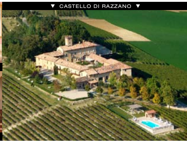
▼ CASTELLO DI RAZZANO ▼