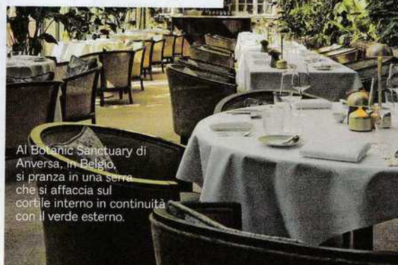
Al Botanic Sanctuary di Anversa, in Belgio, si pranza in una serra che si affaccia sul cortile interno in continuità con il verde esterno.

Il Botanic Sanctuary, ex monastero del XV secolo, oggi hotel, unisce la storia con il design sostenibile, un giardino di 220 metri quadrati e tre ristoranti stellati. La moderna serra ospita il 1238 Restaurant dello chef Pascal Duvivier, dove è un must assaggiare il granchio con aceto di foglie di ribes nero e bouillon di nori freddo, evocazione del Mare del Nord con un tocco di campagna (botanicantwerp.be).