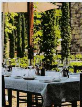
SADIK SANS VOLTAIRE